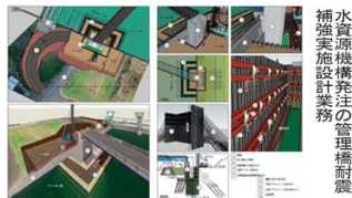
水資源機構発注の管理橋耐震補強実施設計業務

升方氏は「技術者自身がBIM/CIMを必要視し、自立した使い方をしなければ、効果を引き出すことはできない」と考え、社内の各グループが主体的に取り組むように方向転換した。技術者一人