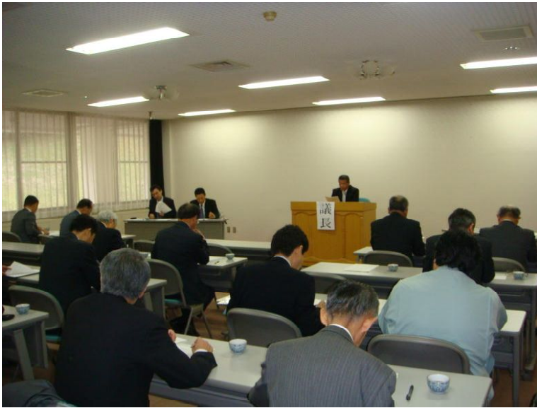
【池原議長による議事進行】

富山県部会は、4月17日（金）富山市「呉羽ハイツ」において、第24回通常総会を22県部会員28人の出席により開催しました。